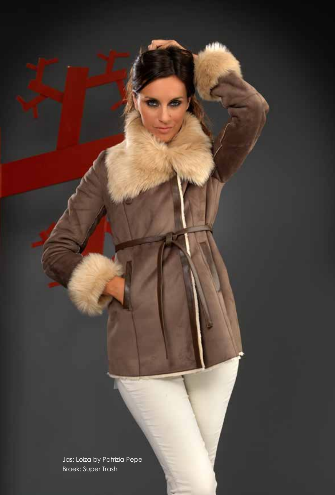
Jas: Loiza by Patrizia Pepe Broek: Super Trash