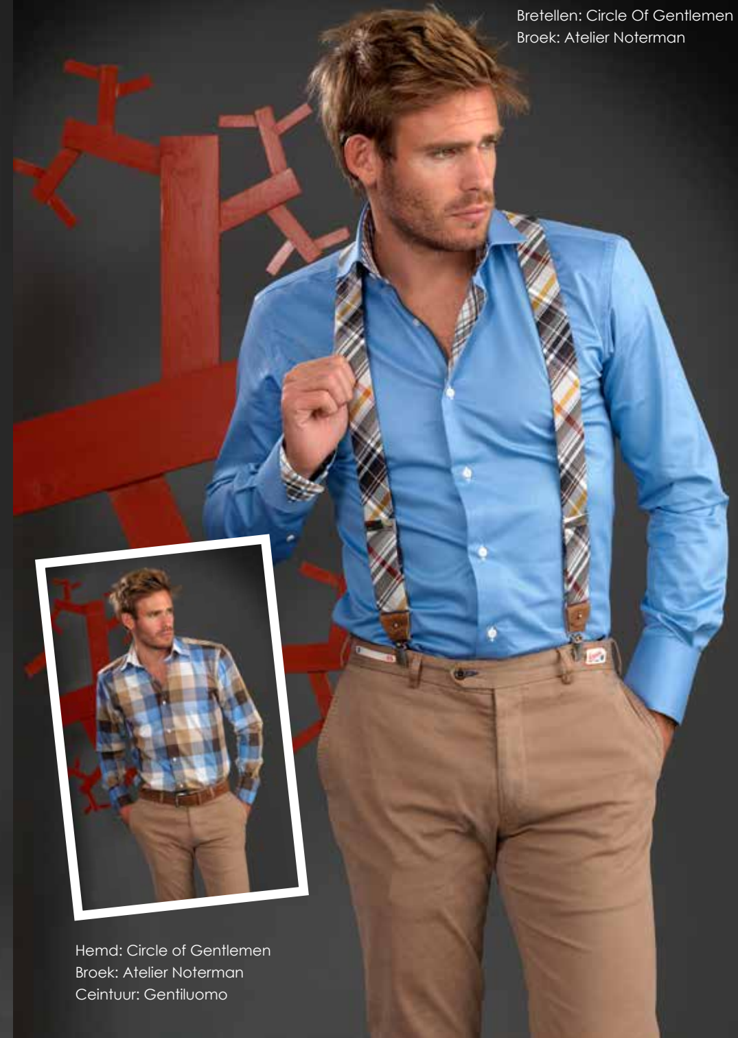
Hemd: Circle of Gentlemen Bretellen: Circle Of Gentlemen Broek: Atelier Noterman