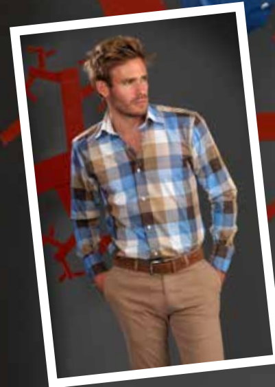
Hemd: Circle of Gentlemen Broek: Atelier Noterman Ceintuur: Gentiluomo