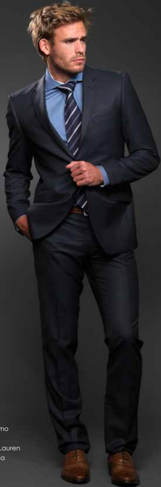
Kostuum: Izac Hemd: Gentiluomo Das: Scapa Ceintuur: Ralph Lauren Schoenen: Scapa