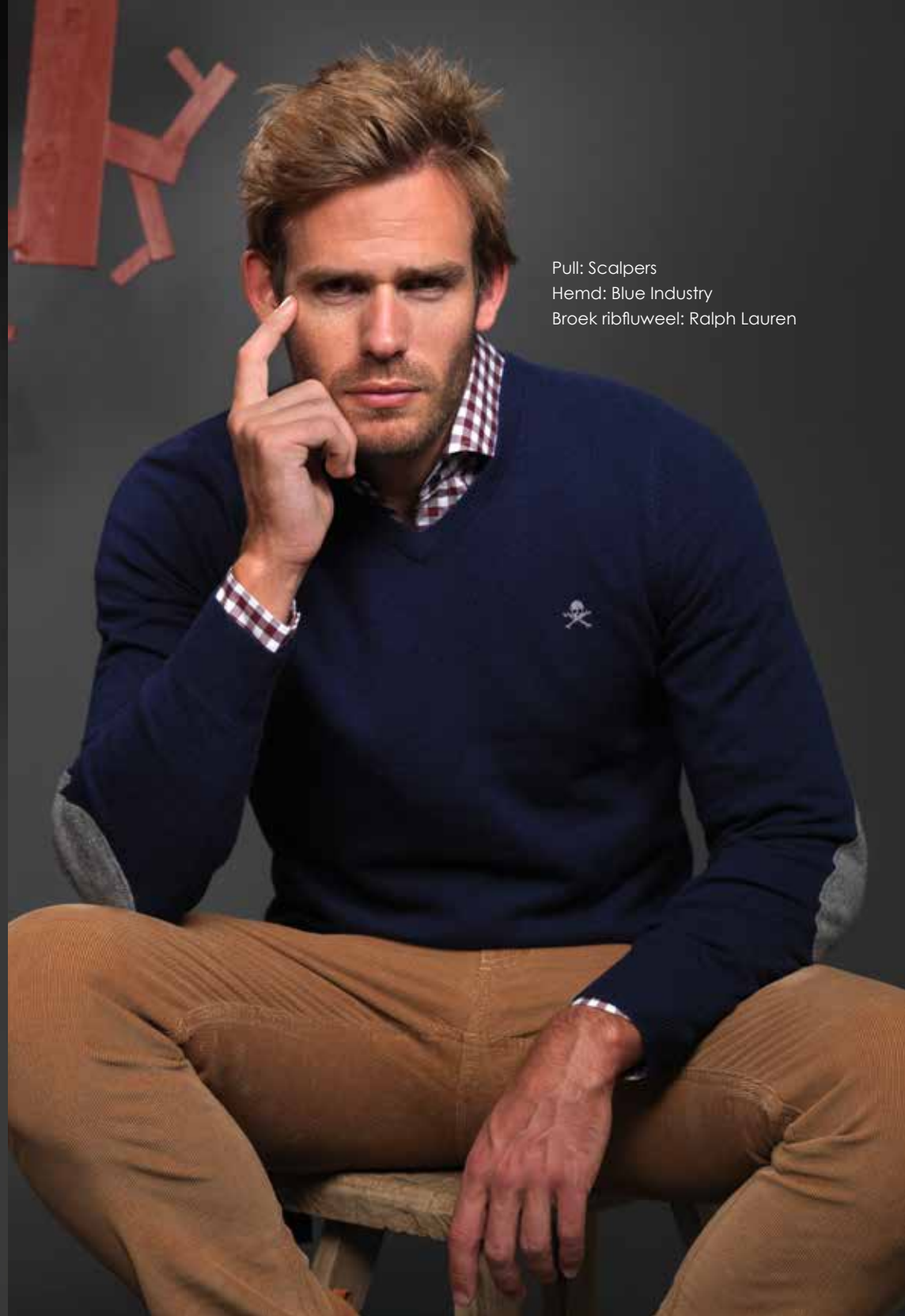
Pull: Scalpers Hemd: Blue Industry Broek ribfluweel: Ralph Lauren